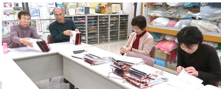
点訳グループ てんゆう会の活動風景