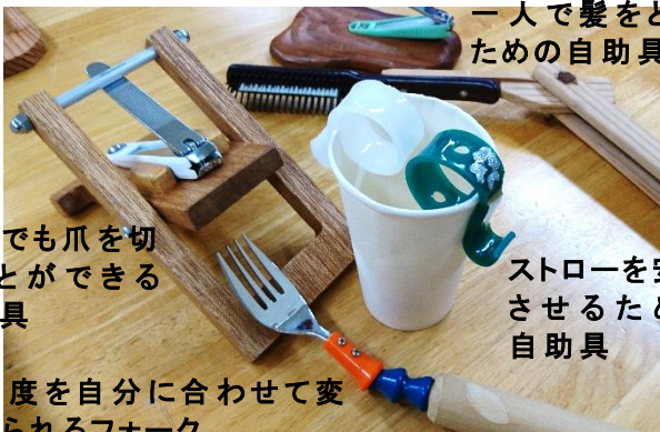
一人で髪をとかすための自助具