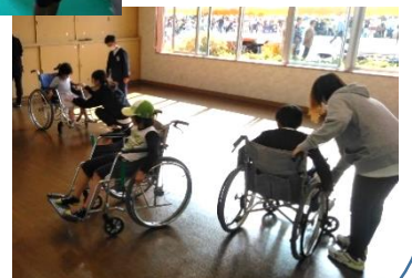
車いす体験コーナー

久井中学校ボランティアの皆さんの活躍も目立ち、地域ぐるみの、あったかくて大きな行事となりました！