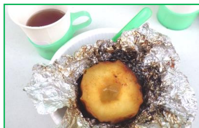
デザート焼きりんごです！