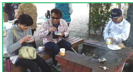
参加された皆さん、 お疲れ様でした！！