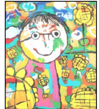
第4期 障害者プラン 概要版 表紙より