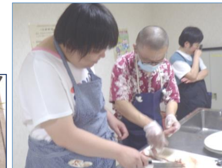
第2弾 サンマのかば焼き