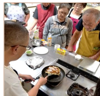
第4弾 ハルオ風 お好み焼き