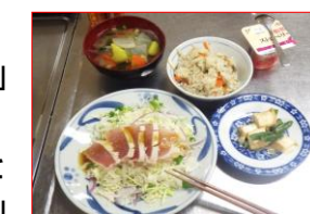
第3弾 びんちょうまぐろのたたき

料理教室に参加された皆と作って食べることがうれしいから、また続けたいと思ったし、「次のメニューは何ですか？」と聞かれた時には「よし、頑張ろう！」と思った。