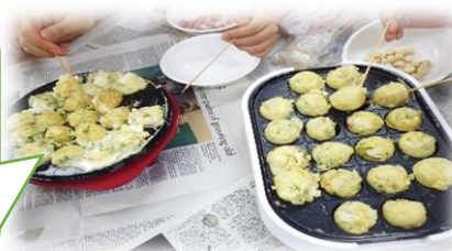
ポン酢やマヨネーズ等、他にも色々な味が楽しめました。

「ソースだけでなく、オリーブオイルと塩が最高！」との声も上がりました。次回は日時を決めてより多くの人に来てもらうようにしたいと思います。お楽しみに。