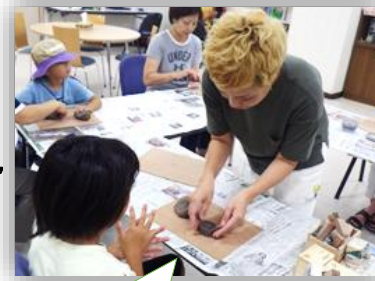
先生に教えてもらいながら作っていきます。