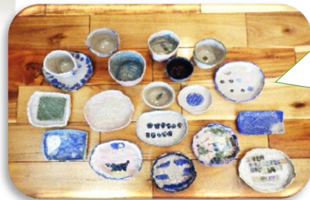
こんなにステキな作品ができあがりました！