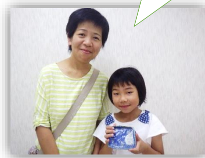
夏休みの思い出ができました！