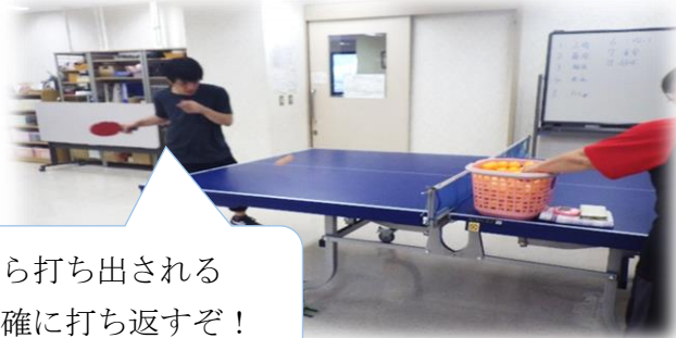
先生から打ち出される球を正確に打ち返すぞ！

8月21日（水）広島県卓球協会の松田先生をお呼びして今年度1回目の卓球講座を開催しました。今回は「ラケットの持ち方」「振り方」そして「正しい打ち方」を学びました。先生の指導で「コツ」をつかみ、少しの時間で上達された参加者もおられました。次回は来年の春休み頃を予定しています。皆さんの参加をお待ちしています。