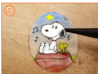
⑤ トースターから取り出しレジン液を塗ります