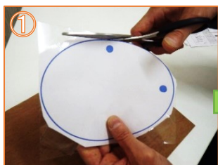
① プラ板からアクセサリの元になる形を切り取ります