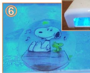
⑥ UVライトで紫外線をあてます