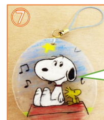
⑦ ストラップなどをつけたら完成です！