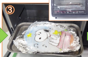
③ 絵を描いたプラ板をトースターで焼きます