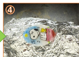
④ 約1/4～1/6ぐらいにイッキに縮まります！ 熱いので注意！