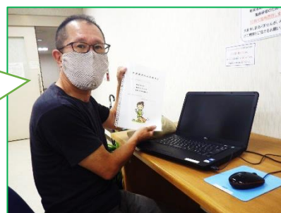
目標の広告を作成されたBさんです。お疲れ様でした！

作成した広告をプリントアウトしてもらいました。自分で作れたので自信になりました。