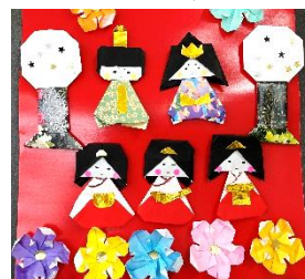
ボラセンに掲示の折り紙