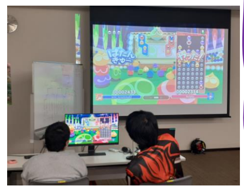
【「いさな」さんとの対戦の様子】