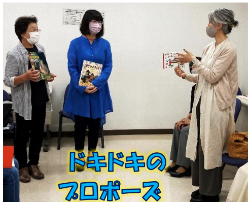
ドキドキのプロポーズ

10月8日（金）の内容は「絵本プロポーズ大作戦」学校の朝読で読む2冊を決めるため、秋の絵本を一人一冊持ち寄ったのですが・・・その決め方がおもしろい！まずは、それぞれが選んだ秋の絵本を1分間でPRします。全員の本の内容がわかった後、自分の本と一緒に読んでほしい本にプロポーズをしていきます。さて見事にカップル成立になるのでしょうか？