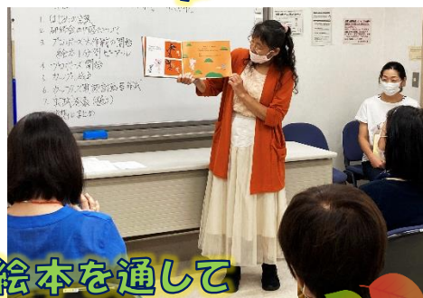
絵本を通して いろいろな秋を楽しみました！

この日は虹の会だけではなく、読み語りボランティア「ねむの木」、南小学校の朝読グループ「みなみん」、第三中学校の朝読グループ「クラムボン」も参加していました。同じ目的を持つグループが交流し刺激しあえることは素晴らしいですね。様々なグループが集まることにより「いろいろな視点から選ばれた本に出あえて良かった。」とみなさん笑顔でした。