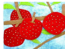
三原コスモス文庫 作製作品