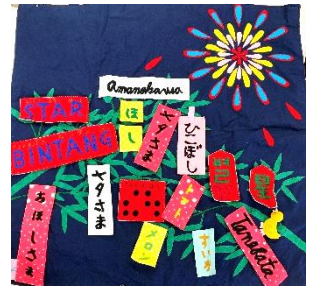
三原コスモス文庫 作製作品