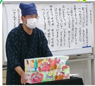
パズル絵本の練習

三原市民提案型事業として開催しました。たくさんの力が集まり、コロナ禍の中で開催できたことに感謝の気持ちでいっぱいです。参加者からは「心があたたかくなりました」「元気をもらいました」等の感想をいただき、達成感！今後も人形劇や読み語りの場に足を運んでいただき、親子の会話に活かしてほしいです。子どもの考える力や感受性を育むきっかけになり、子育てが楽しくなることを願っています。