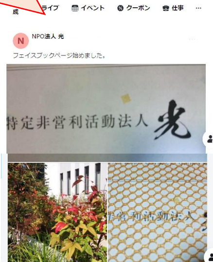
実際に投稿されたページ

第2回目までに宿題が出されました。「Facebookに使用する写真を撮影してくること！」