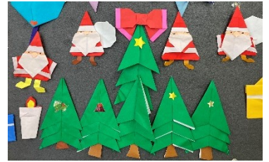
ぼらせんに掲示の折り紙