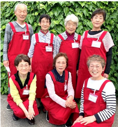
メンバー14人中の7人が集合

コロナ禍では、施設に全く入れない期間が続き、喫茶の活動は中止していました。しかし、活動を止めることなく、花壇の手入れやウエス作り等、コロナ禍でもできることを続けてきました。昨年5月からは人数を制限しての喫茶が再開され、11月にはメンバー全員での活動ができるようになりました。