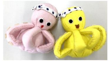
三原コスモス文庫の作品