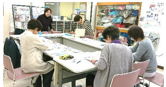
てんゆう会活動風景