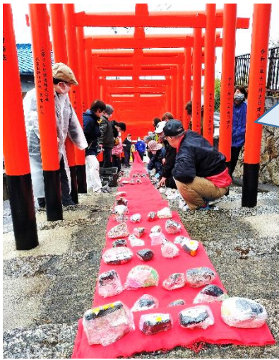
24日(金) 大島神社 石雛の配置風景

24日(金)は3か所(宗光寺・大島神社・正法寺)の石段に石で作った石雛を配置しました。本町のみなさんと一緒に声を掛け合いながらバランスよく並べていきました。