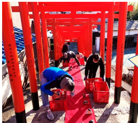
26日(日) 大島神社 石雛の回収風景

長い毛せんをたたむには人数が必要！途中でねじれたり苦戦しながらも、わいわい楽しくたたんでいきました。