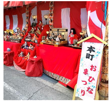
道沿いにもお雛さまが飾られていました。

今年度は以前より少しずつボランティア活動の場が増えています。2月19日～3月5日まで開催された第1回本町お雛まつりでも、個人ボランティアが活動しました。