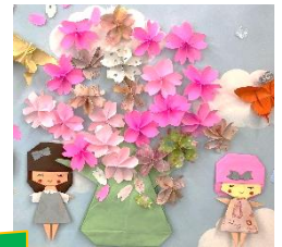
ボラセンに 掲示の折り紙