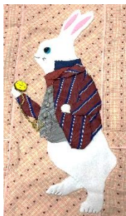
うさぎのエプロンを着て読み語りをしています。

会員は随時募集中。毎月第1水曜日の13時30分から定例会をしています。久井図書館等でもお話し会に参加しています。ご興味のある方はボランティアセンターまでお問い合わせください。