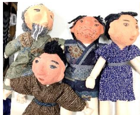
手作りの紙芝居と人形