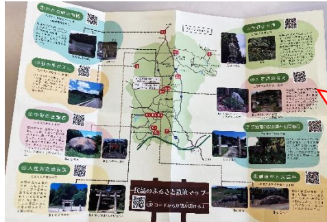
久井の民話にまつわる遺跡が紹介されています。